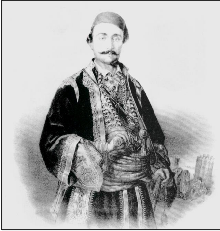
хајдук Вељко Петровић, војвода Крајинске нахије

У новим околностима устанком захваћене Крајине, Михаило Карапанџић постаје војвода крајински, а после његове смрти 1811. године, за војводу Крајинске нахије именован је 21. августа 1811. године хајдук Вељко Петровић 20 , чиме је старешинство у Крајинској нахији прешло на породицу Петровић.