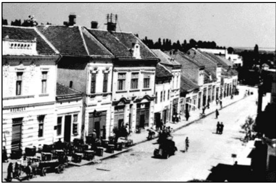
Неготин, друга половина XIX века