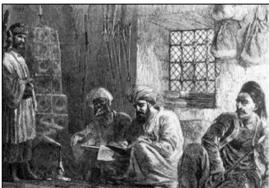
судница Ибрахим – бега, репродукција из књиге Феликса Каница “Србија”

Међутим, у освојеним областима Османлије нису укидале домаће законе, обичаје и институције (“влашки статус” је остао као делимично ревидиран, а на простор Србије пренет је директно из српског средњовековног уређења), већ су се у почетку прилагођавале постојећем систему, па тако су вршиоци пописа становништва (ил-јазичије, дефтерлари) у свакој области, поред уписа главе породице у дефтер ради утврђивања пореза, давали и предлоге за ревизију или допуну локалних закона 11 . Сваки санџак и већи субашлук је имао свој дефтер